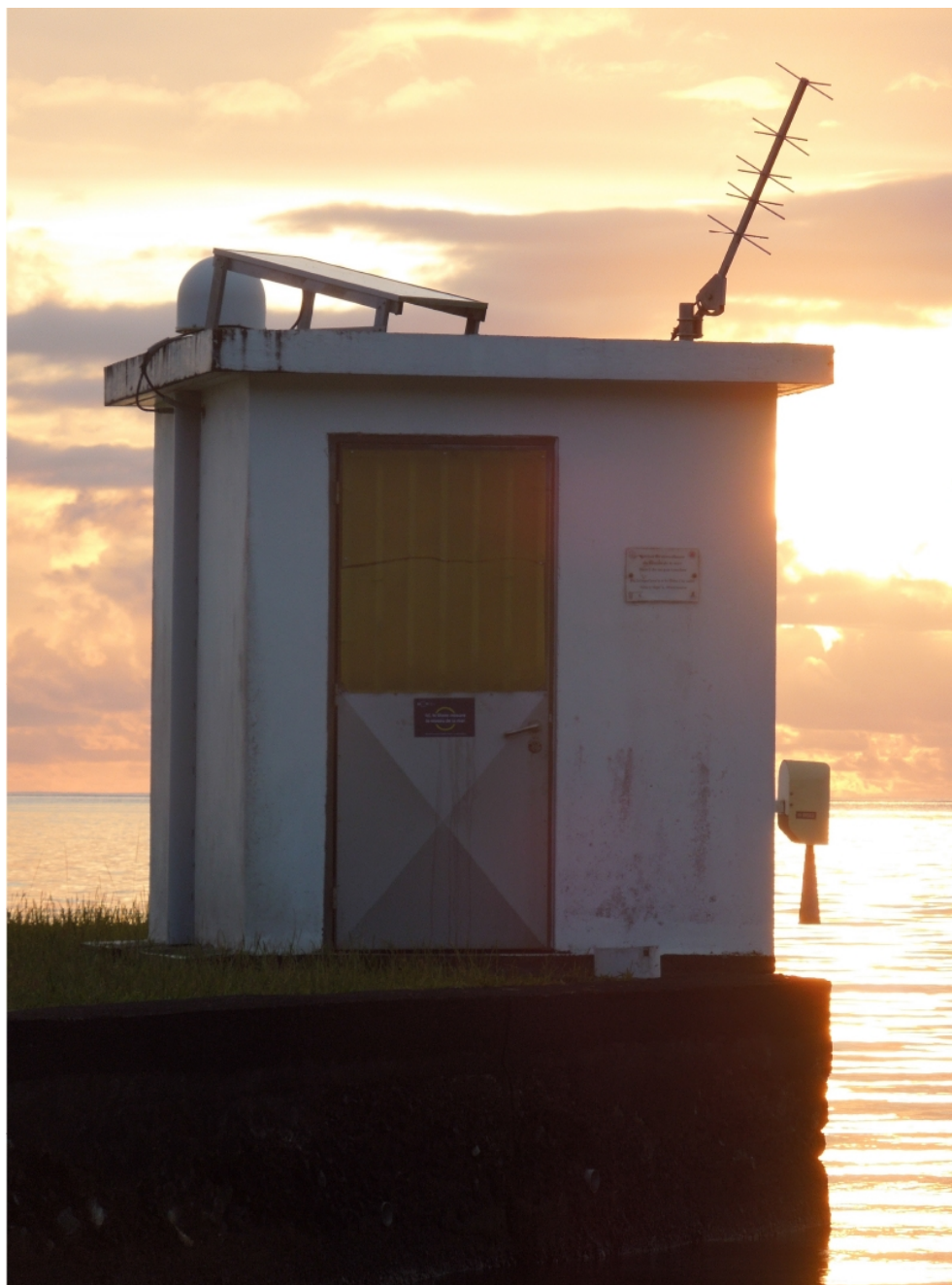
Station d'observation du niveau marin de Vairao (Tahiti-Iti)

URL source: http://www.upf.pf/fr/content/conf%C3%A9rence-savoirs-pour-tous-sur-l%E2%80%99%C3%A9volution-du-niveau-de-la-mer-en-polyn%C3%A9sie-fran%C3%A7aise