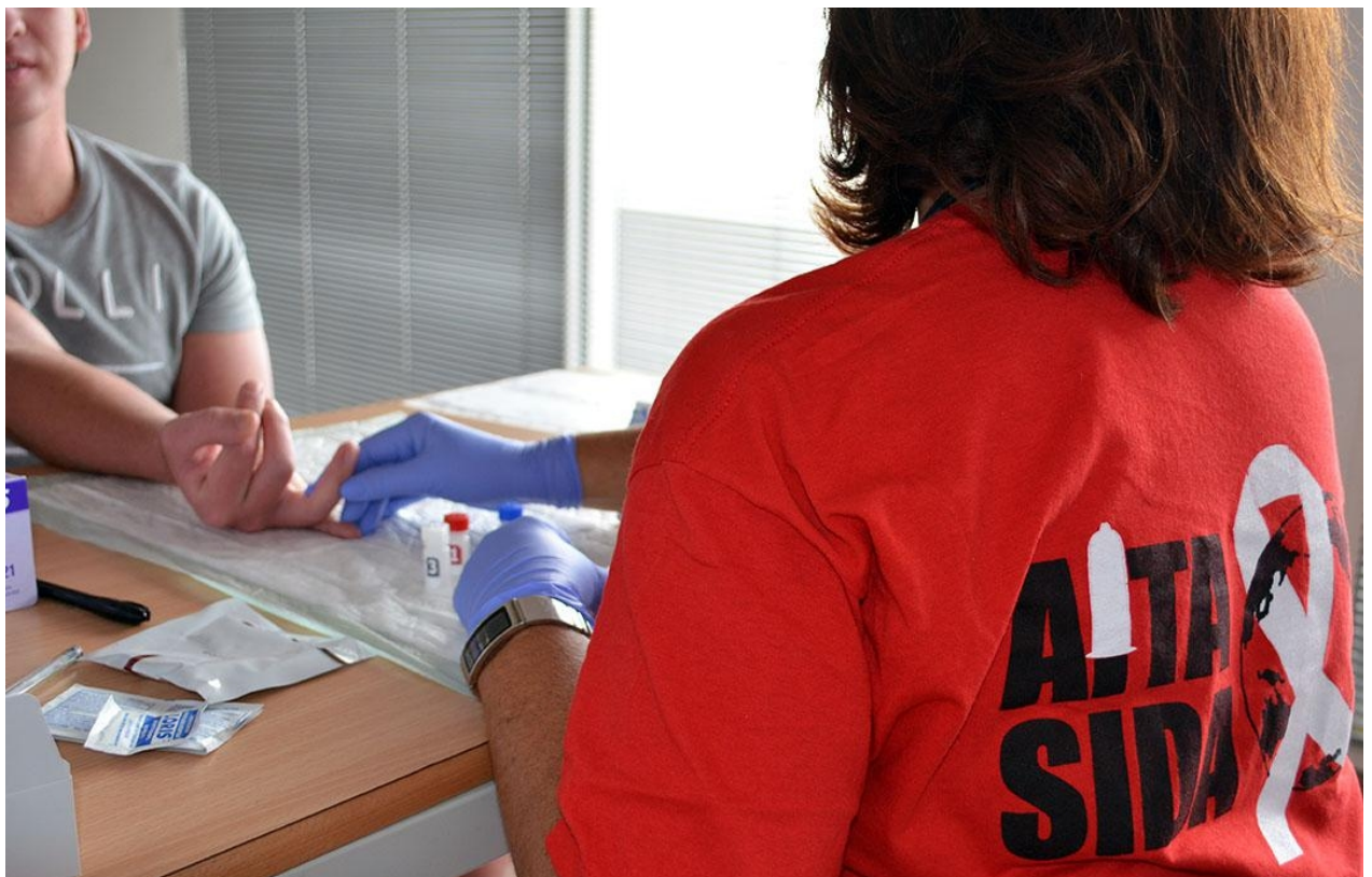
[8] Tests gratuits et confidentiels