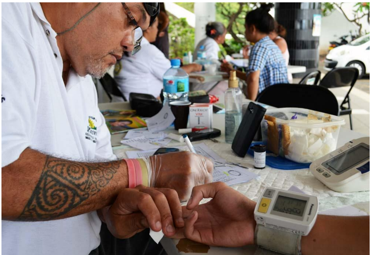
[4] Tests pour la prévention de l'obésité et du diabète