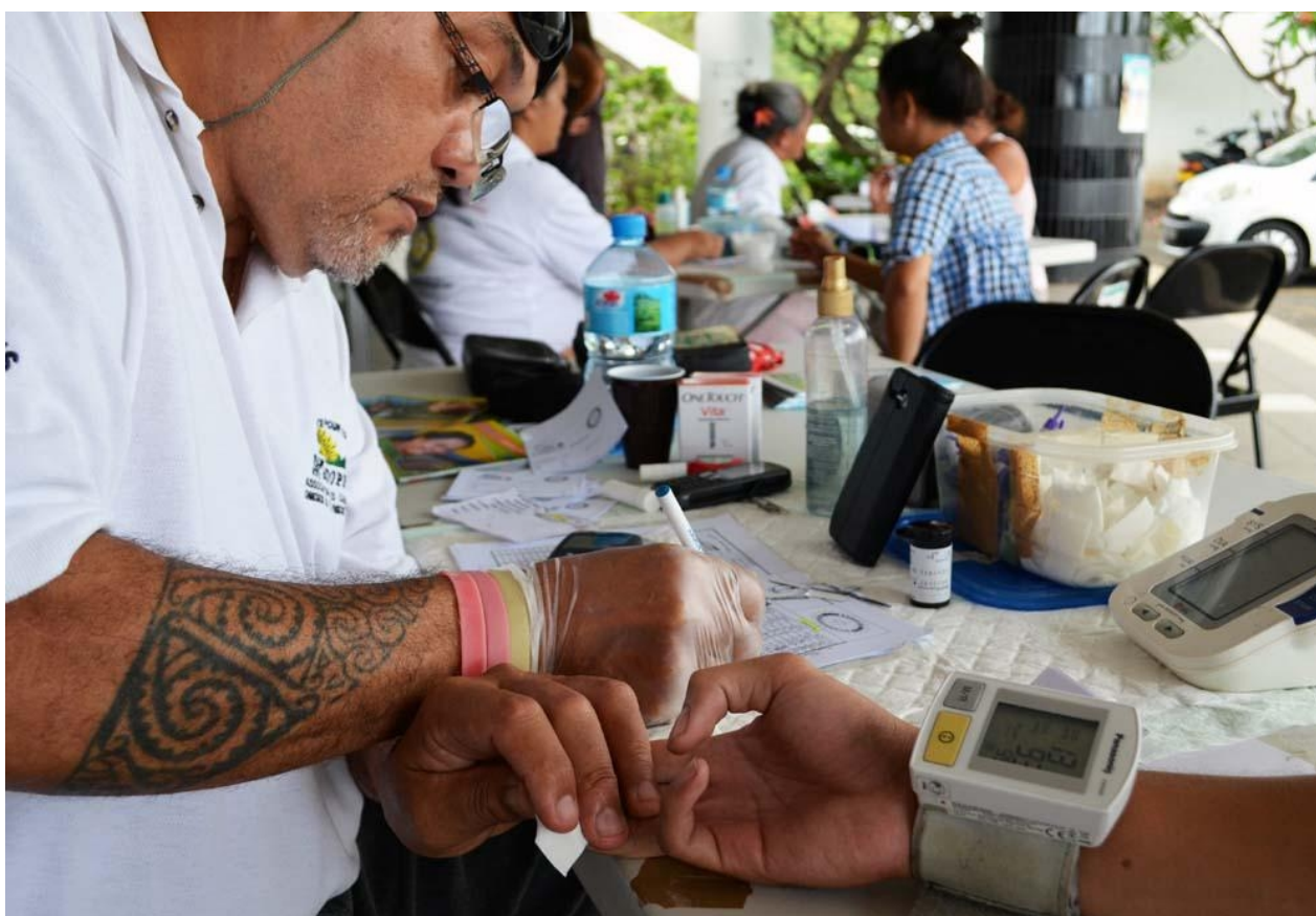
[4] Tests pour la prévention de l'obésité et du diabète