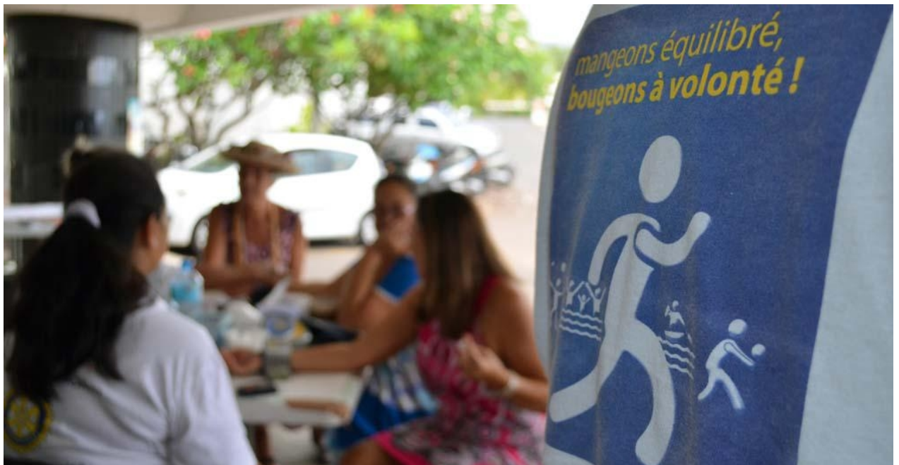
[3] Alimentation et prévention de l'obésité et du diabète