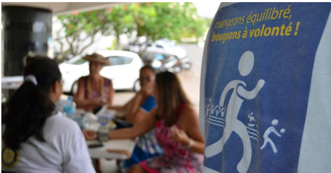
[3] Alimentation et prévention de l'obésité et du diabète