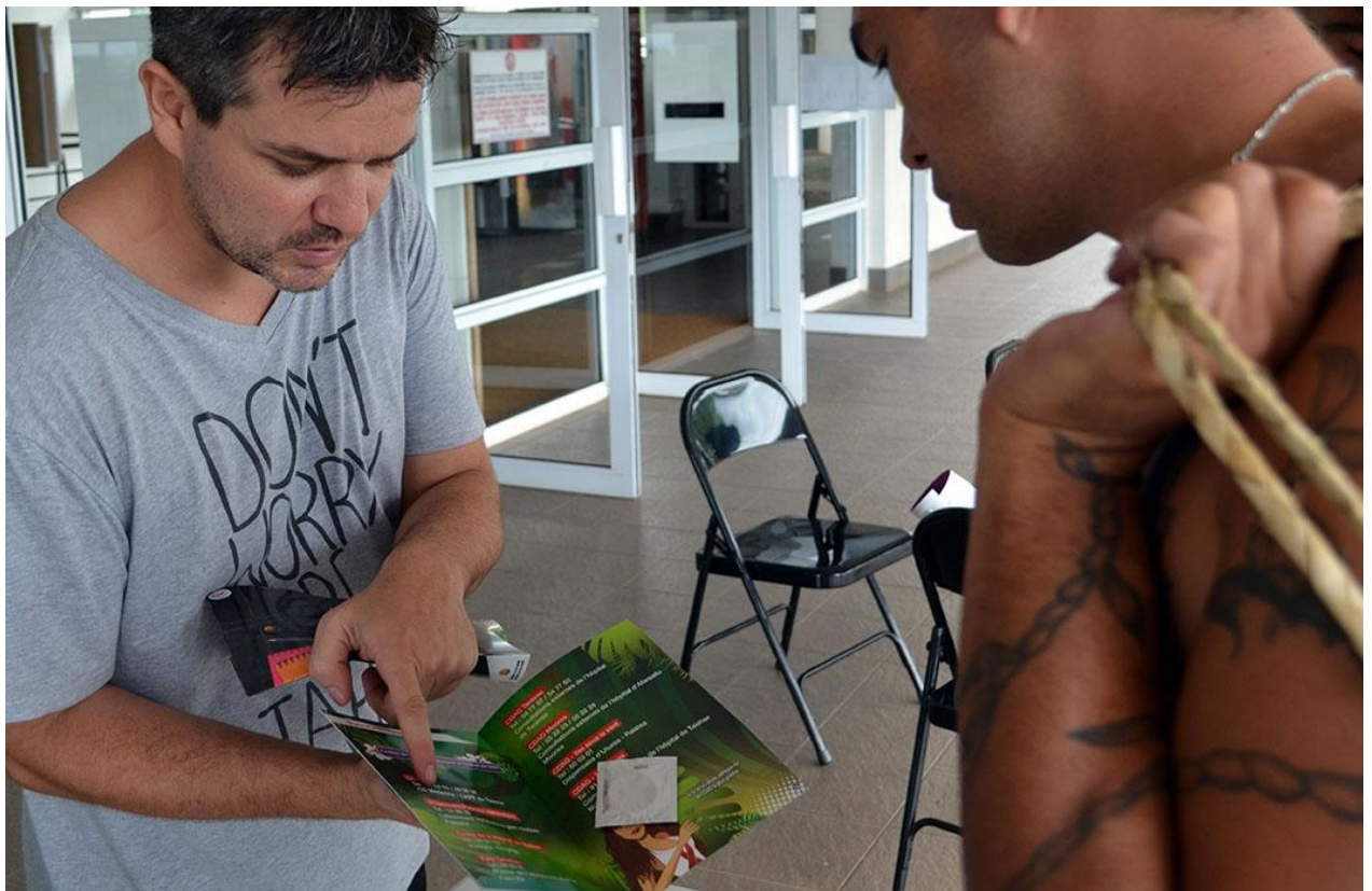
[7] Prévention sida et MST avec l'infirmier