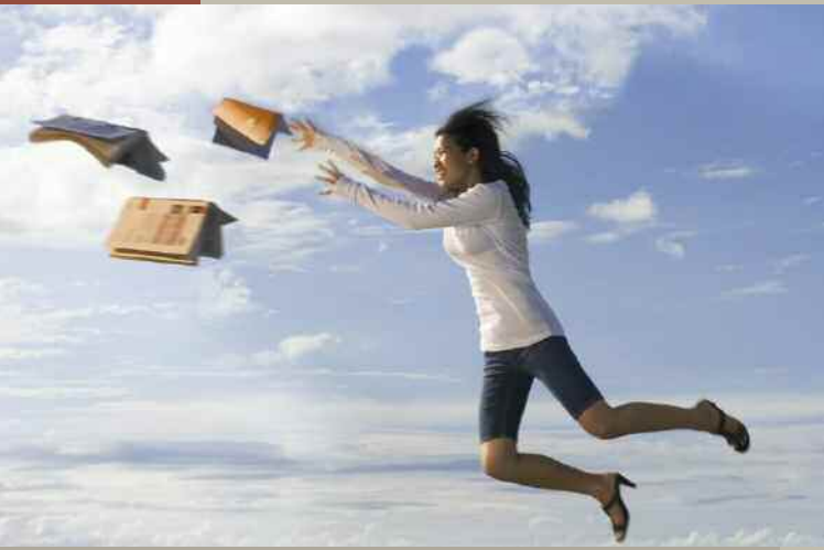
1 er prix du concours Regards d'étudiant 2007.