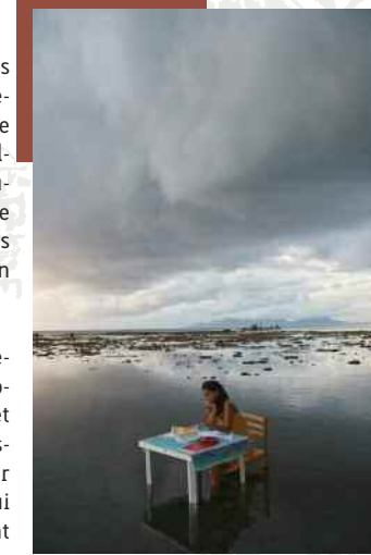
2 e prix du concours Regards d'étudiant 2007.